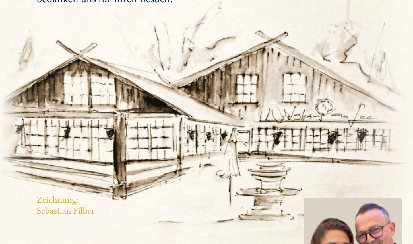
Zeichnung: Sebastian Filber

Bayern, Naturliebhaber und unsere hessischen Freunde werden es in ihr Herz schließen. Es erwarten Sie jede Menge Schmankerl aus der süddeutschen Küche, allerlei frisch Gezapftes und ausgesuchte Destillate in einer wundervoll idyllischen Atmosphäre. Tauchen Sie ein und genießen mit uns sowohl ein paar angenehme, als auch unterhaltsame Stunden. Wir wünschen Ihnen eine unvergessliche Zeit und bedanken uns für Ihren Besuch.